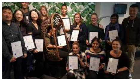
BHV Hotel Court Garden 70 kamers