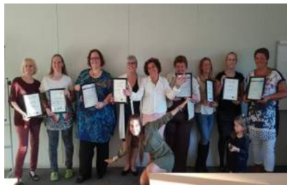
Scholingsproject op onze locatie

Iedere training kan tegen zeer aantrekkelijke groepspreizen worden ingekocht voor maximaal 12 deelnemers per lesdag. Deze prijzen variëren van 1.095 tot 1.750 per lesdag. Wanneer u een groepscursus inkoopt, dient u er rekening mee te houden dat de examenkosten per deelnemer hier nog bovenop komen, wanneer het afleggen van een examen nodig is.