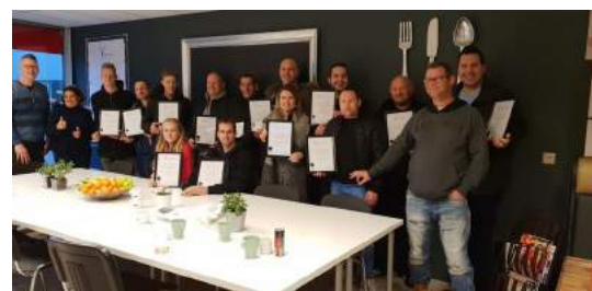
Training voor zzp-ers op onze locatie